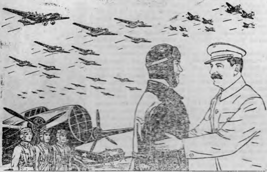
Рисунок В. Баркова и В. Лисевича.