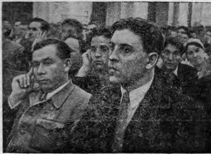
В зале заседаний Сессии. На переднем плане—депутат А. Г. Стаханов.

5 августа состоялось совместное заседание Совета Союза и Совета Национальностей по четвертому вопросу порядка дня: заявление Полномочной Комиссии Сейма Латвийской Республики.