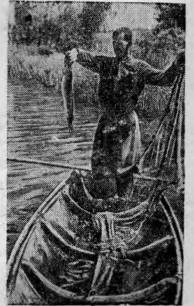
Колхозник Б. Н. Мочалин на ловле рыбы в колхозном пруду. Он вырабатывает от 3 до 10 трудовых в день.

В пруду колхоза «Пролетарка (Красноуфимский район, Свердловская область) с 1937 г. разводится зеркальный карп и сазан. В прошлом году колхоз получил от рыбного хозяйства 25 тысяч рублей дохода.