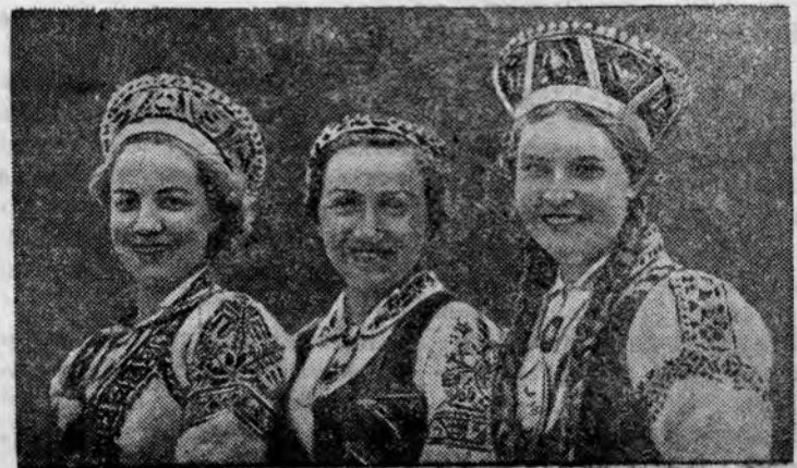
Латвийская молодежь в национальных костюмах.